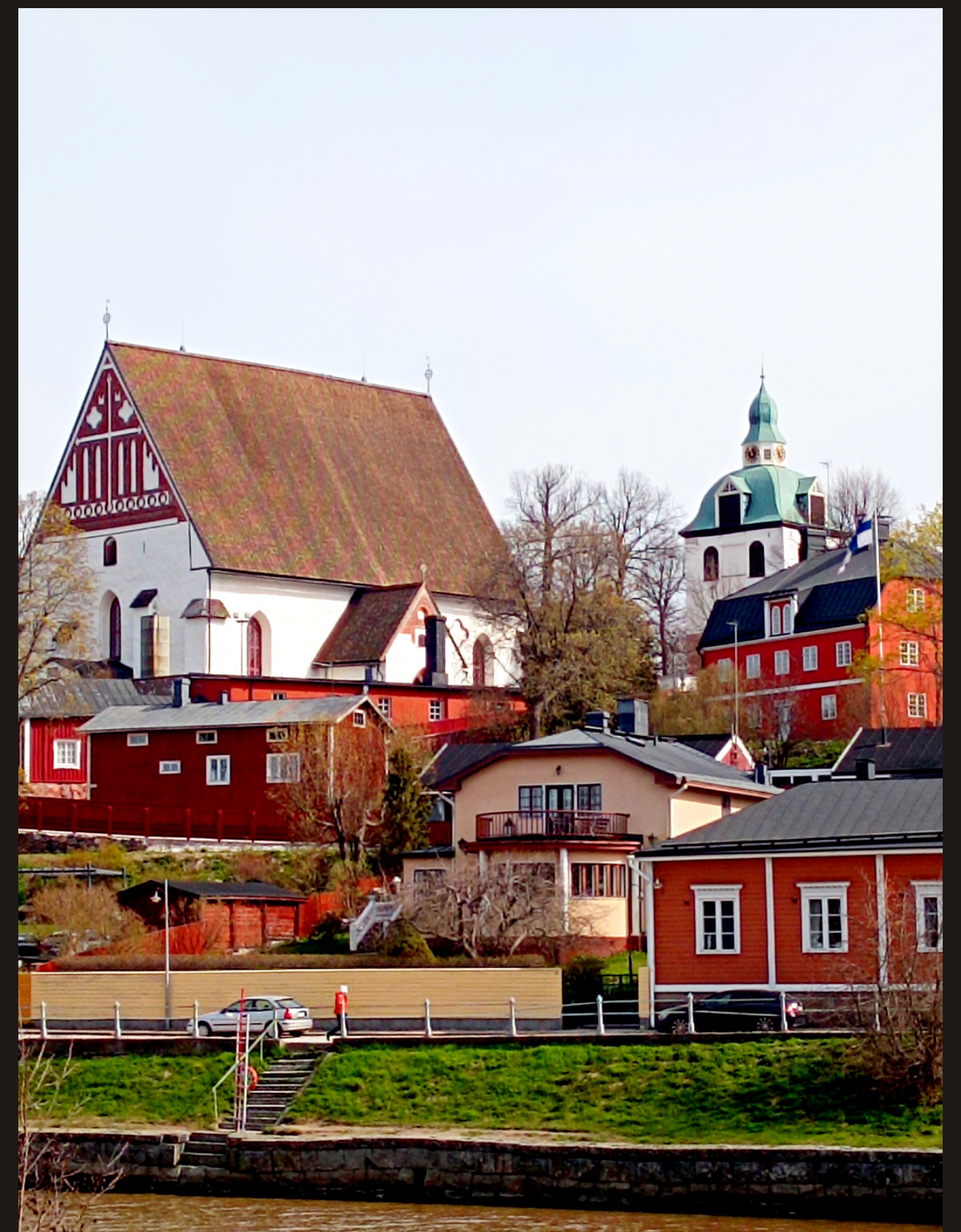
Porvoo, ciudad medieval de la costa sur de Finlandia, 47700 habitantes