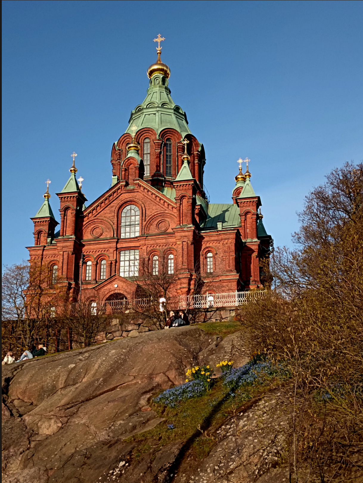
Iglesia ortodoxa rusa