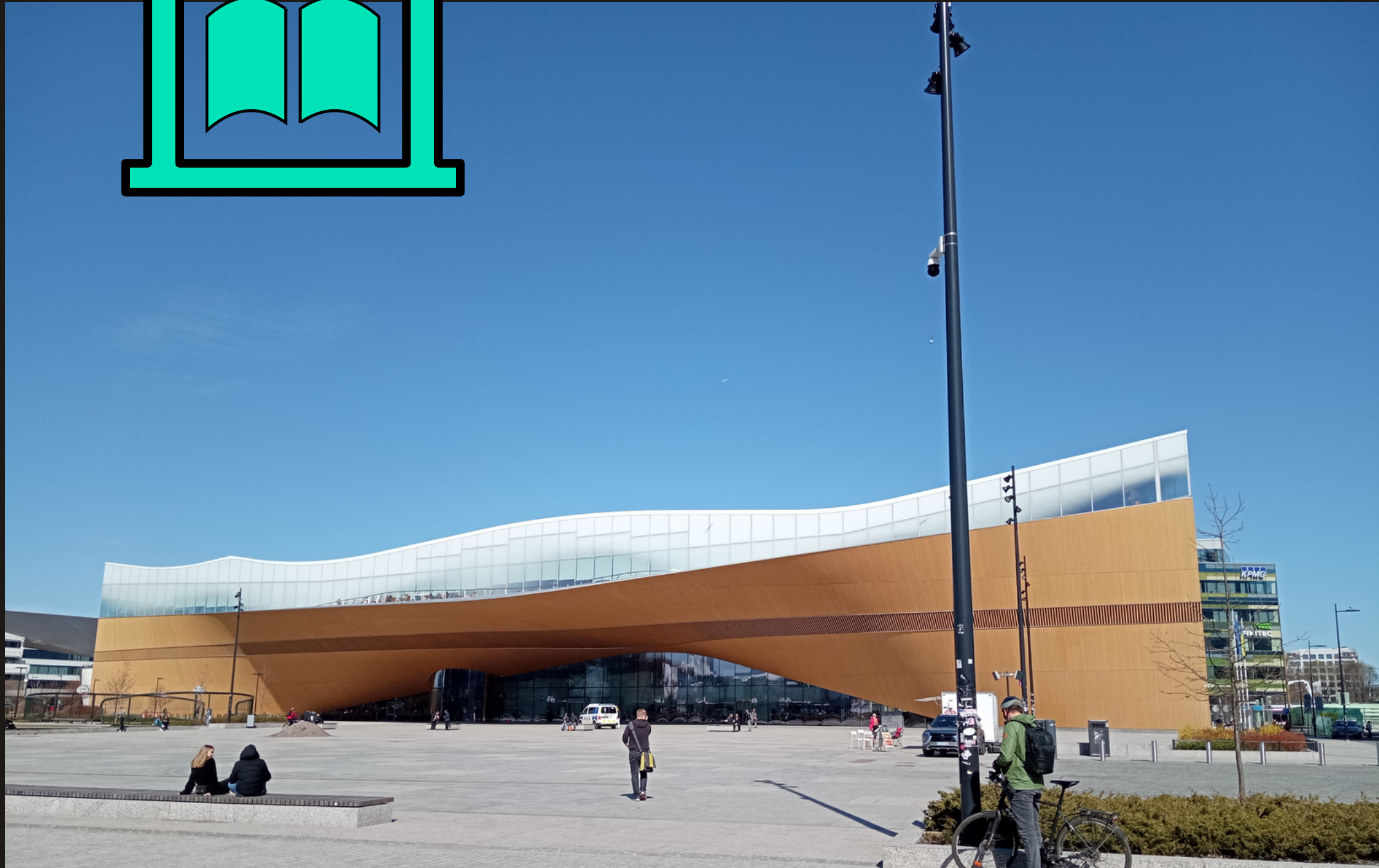
Oodi, desde 2018 una de las 37 bibliotecas de Helsinki